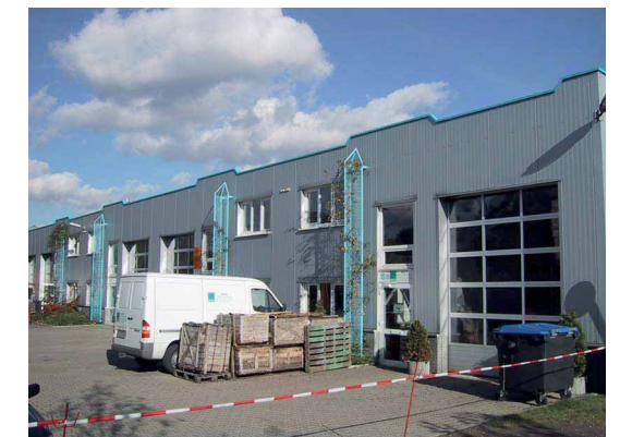
Blick auf eine Einheit