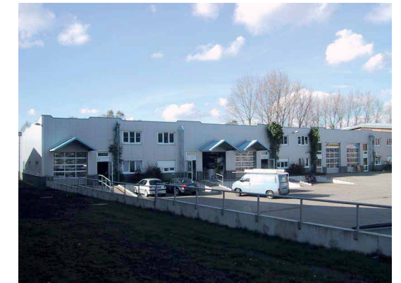
Blick vom Hofgelände

Das Hildener Gründerzentrum wurde 1998 erbaut. Es umfasst 12 gleich große Einheiten, die jeweils mit den angrenzenden Einheiten räumlich verbunden werden können. Die Grundfläche der Einheiten beträgt ca. 150 qm. Davon sind ca. 122 qm als Service-, Lager- oder Produktionsflächen vorgesehen. Die Bürofläche beträgt ca. 28 qm und kann mit einem Obergeschoss noch einmal um diese Fläche erweitert werden. Jede Einheit besitzt eine Nasszelle mit Toilettenanlage, Waschbecken und Dusche sowie eine Küchenvorrichtung. Sie verfügen über ein hochwertiges elektrisch betriebenes Hubsegmenttor und eine separate Eingangstür. Die Fenster sind in Isolierverglasung ausgeführt. Der Vorhof der Halle ist abgesenkt, so dass die Einheiten problemlos von Lastkraftwagen beliefert werden können. Die Wärmeversorgung erfolgt über eine Heiztherme.