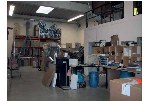
Blick in den Innenraum